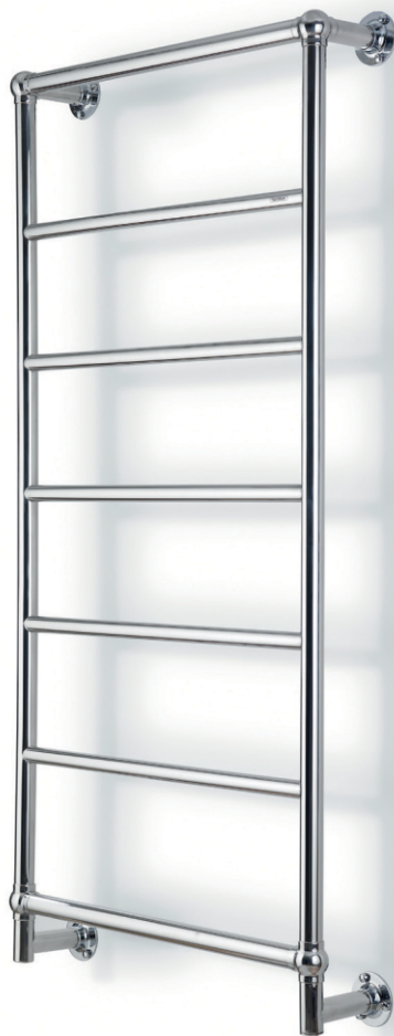
1366 X 667 Полирана повърхост