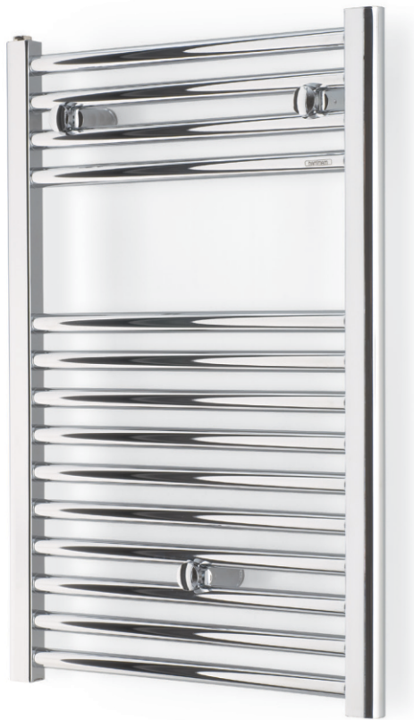
688 X 500 Хромирана повърхост